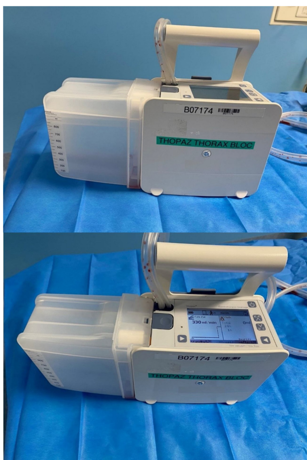
Figure 3. Exemple d'un dispositif de drainage numérique.

de contrôler l'aspiration (colonne de Jeanneret) avec une hauteur de la colonne d'eau correspondant à la dépression appliquée au système. Des dispositifs de drainage aspiratifs portatifs numériques sont également disponibles (Fig. 3). Il faut veiller lors de l'installation du patient pour le transport, à ce que le drain ne soit ni coudé ni pincé, et surveiller visuellement le pansement du drain, et la survenue d'un emphysème sous cutané.